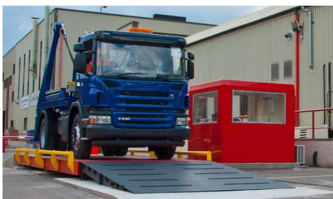
TRẠM CÂN NGUYÊN LIỆU