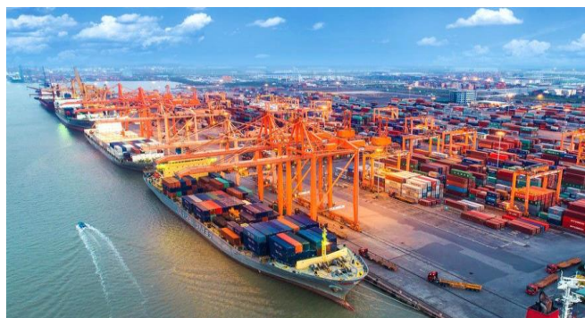
TRẠM CÂN CẢNG BIỂN