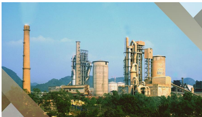
TRẠM CÂN XI MĂNG