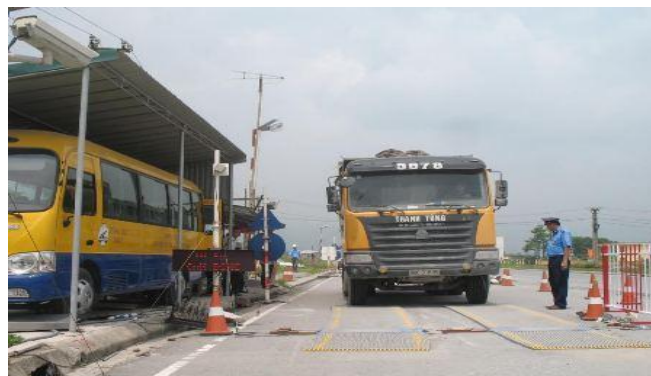
TRẠM CÂN GIAO THÔNG