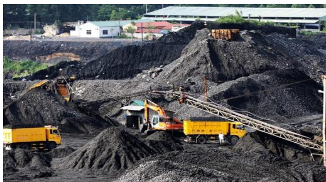
TRẠM CÂN KHOÁNG SẢN