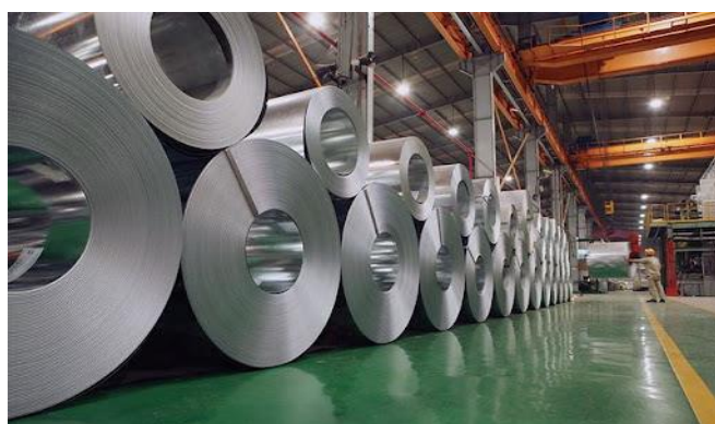
TRẠM CÂN NHÀ MÁY THÉP